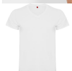
Duo Concept CA6549