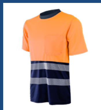
32 Marino/Naranja AV