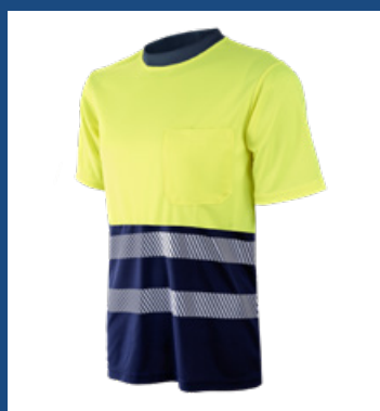
31 Marino/Amarillo AV