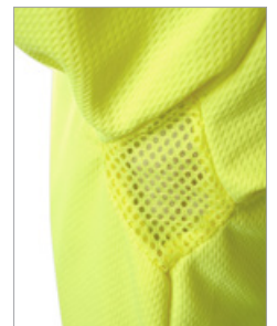
Detalle de las axilas