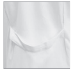
Cinturón trasero con pinzas