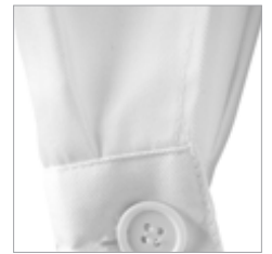
Puños con cierre de botón