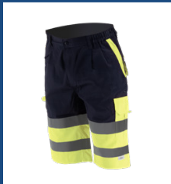
031 Marino/Amarillo AV