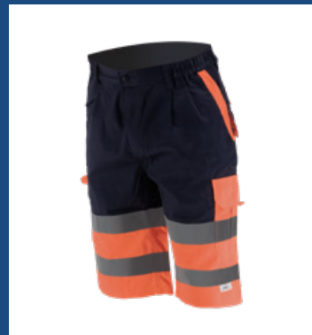
032 Marino/Naranja AV