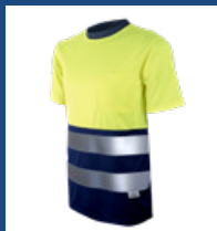
031 Marino/ Amarillo AV