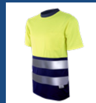
041 Azulina/ Amarillo AV