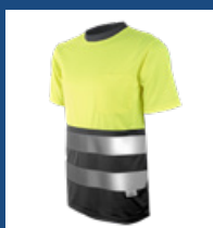
051 Gris/ Amarillo AV