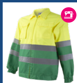
101 Verde medio/Amarillo AV DESCATALOGADO (últimas unidades)