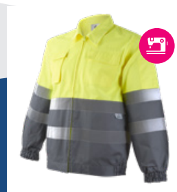
051 Gris/Amarillo AV