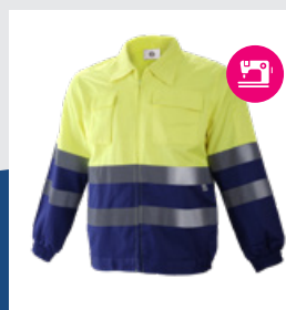
041 Azulina/Amarillo AV