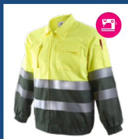
091 Verde oscuro/Amarillo AV DESCATALOGADO (últimas unidades)