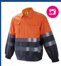
052 Gris/Naranja AV