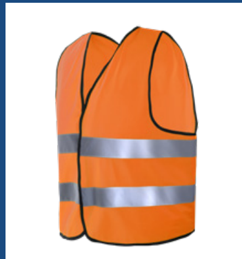
002 Naranja AV