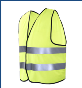
001 Amarillo AV