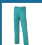
011 Verde claro