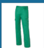
010 Verde medio