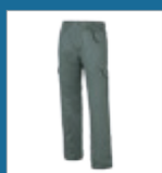
009 Verde oscuro